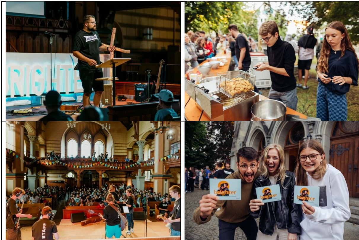
Brighter Impressionen aus Wetzikon, 1. Juli 2022.