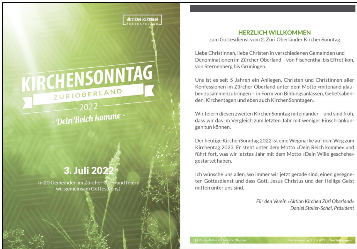
Broschüre (Auszug) zum KirchenSonntag 2022