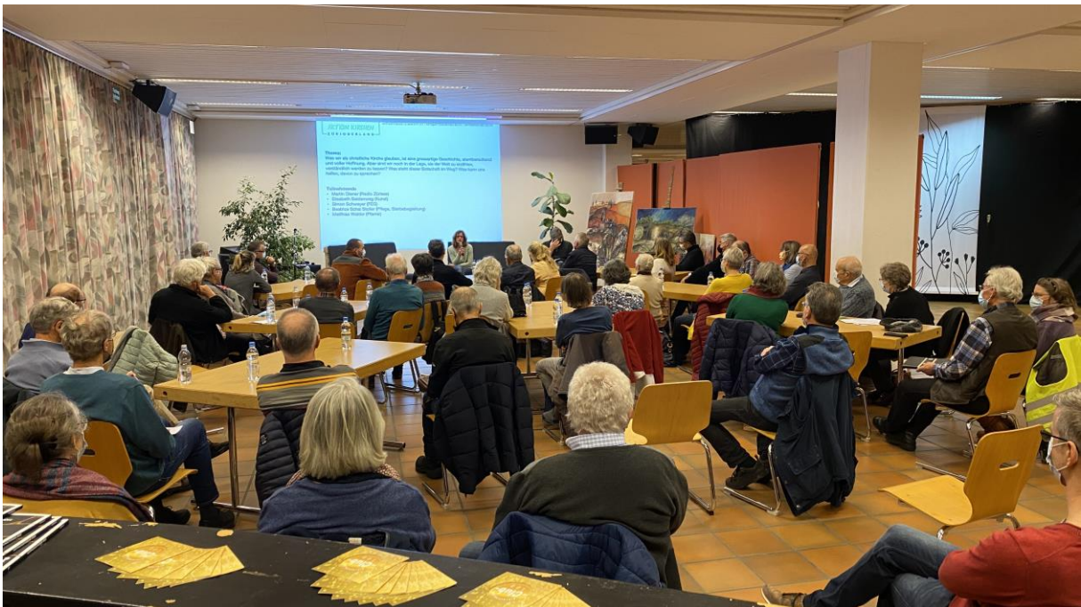
Gut besuchte Impulsveranstaltung am 19. Januar 2022 in Wetzikon.