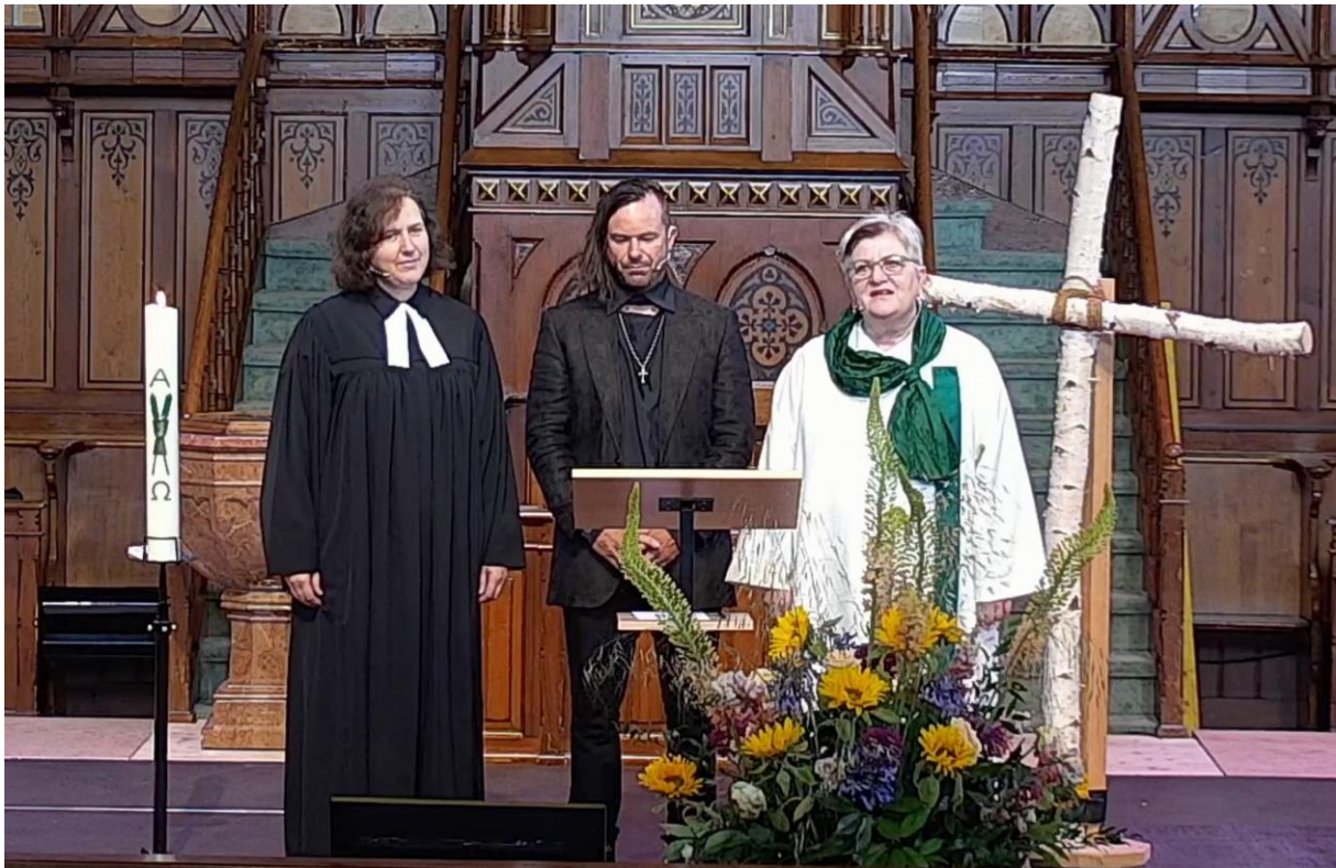
Aufzeichnung Gottesdienst (Screenshot)

Folgende Gemeinden beteiligten sich am KirchenSonntag 2022