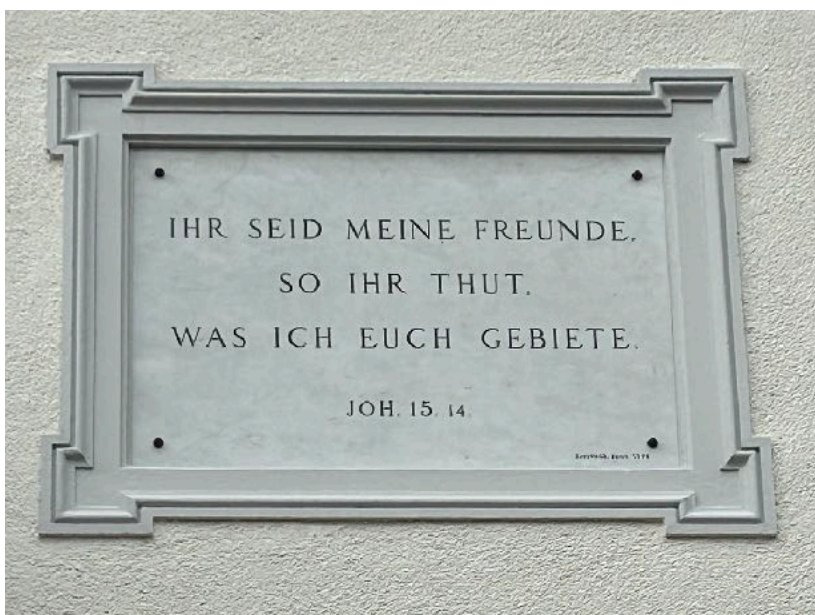
Tafel an der Kapelle zum elcasa (ehem. Bibelheim) in Männedorf.